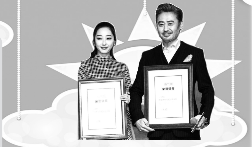
峰会现场,影视明星吴秀波和蒋梦婕被授予“墨迹天气气候公益大使”,未来将共同参与气候环境公益相关的活动。

“今天阳光真好,天空看起来很通透,在北京已经感觉很幸福了。” 不知不觉间,亲朋好友见面,总爱聊上几句天气的话题。与上一代人见面开场就问“吃了没”不同,如今我们不再只关注生存的话题,更关注生活的话题。 好的天气越来越成为人们关注的重点,因为我们不再希望它们稀缺。在一个冬日暖阳的下午,一场由南方周末联合墨迹天气、阿拉善SEE公益机构、WWF世界自然基金会举办的“Hi气候公益峰会”在京拉开帷幕。 气候变化与每一个人的生活紧密相连。来自政府、公益机构、学术界、媒体和企业的嘉宾齐聚一堂,为应对全球气候问题献计献策,并号召更多公众、企业共同肩负起责任,掀起应对气候变化的社会热潮。