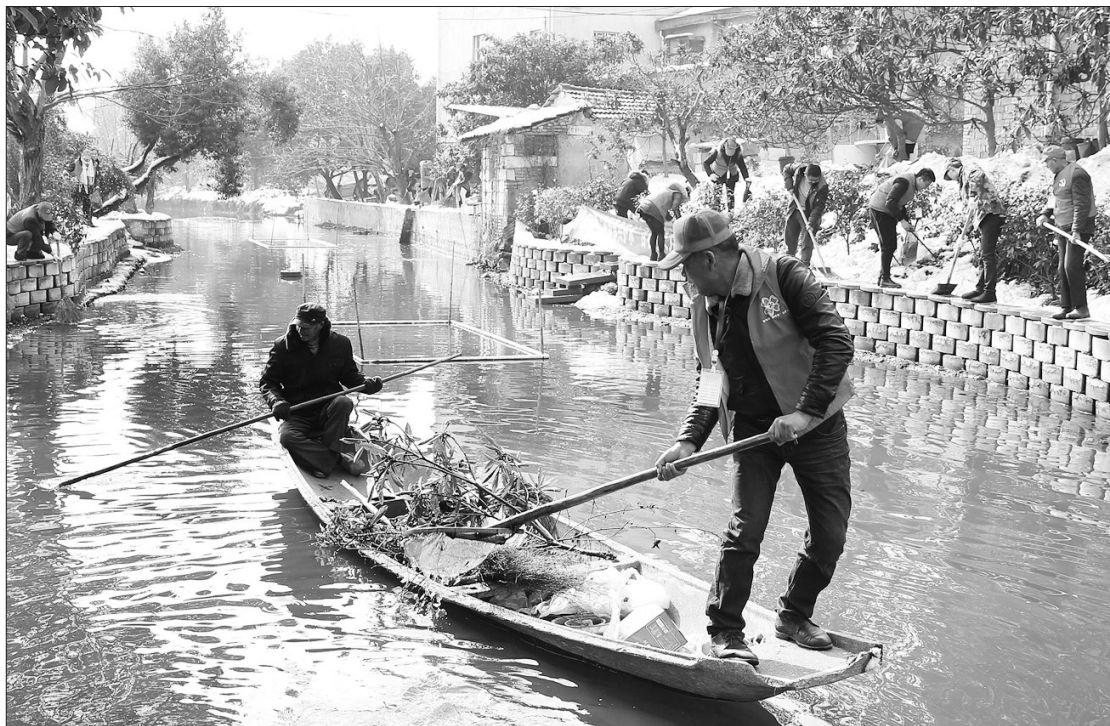
浙江省德清县近日开展“迎新共护水”千名河长巡河活动,以洁净一新的河道面貌迎接新春。图为德清县雷甸镇近百名镇、村河长一起清理溪家桥河道内的新枝枯叶及河道两岸垃圾。

这些企业主要存在未按规范要求建设危险废物贮存库,废机油库无防渗、泄漏液体导流收集装置,泄漏机油对地面已造成污染,污泥库未设置防雨设施;企业产生的煤焦油、污泥、废机油未与危险废物经营单位签订利用处置合同,煤焦油交给无资质企业利用;废矿物油、废焦油、废铅蓄电池、大修渣台账记录混乱,现场无出入库台账记录,且在固体废物信息管理系统只申报了大修渣,其他未进行申报等问题。