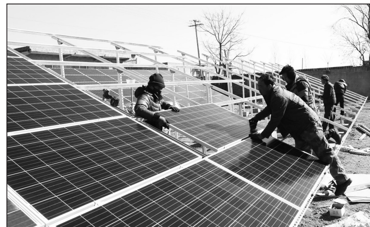
河南省汝阳县蔡店乡妙东村投资88万元积极发展光伏发电,装机容量120kw,总面积1000平方米。目前,光伏电板安装基本结束,并网发电后,项目收益将用于改善居民生产生活条件。

下一步,黑龙江省将强化组织领导,进一步理顺自然保护区管理体制机制。坚决制止和惩处破坏保护区内生态环境的行为,严肃追责问责。加大督查力度,扎实整改自然保护区突出生态环境问题。开展基础调查,进一步掌握和摸清自然保护区家底。