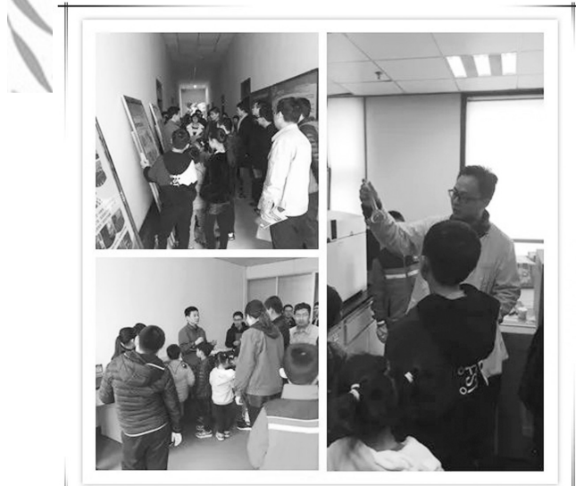
在河北省环境监测中心,工作人员向职工家属介绍河北省遥感、环境应急监测情况,并现场演示设备操作。