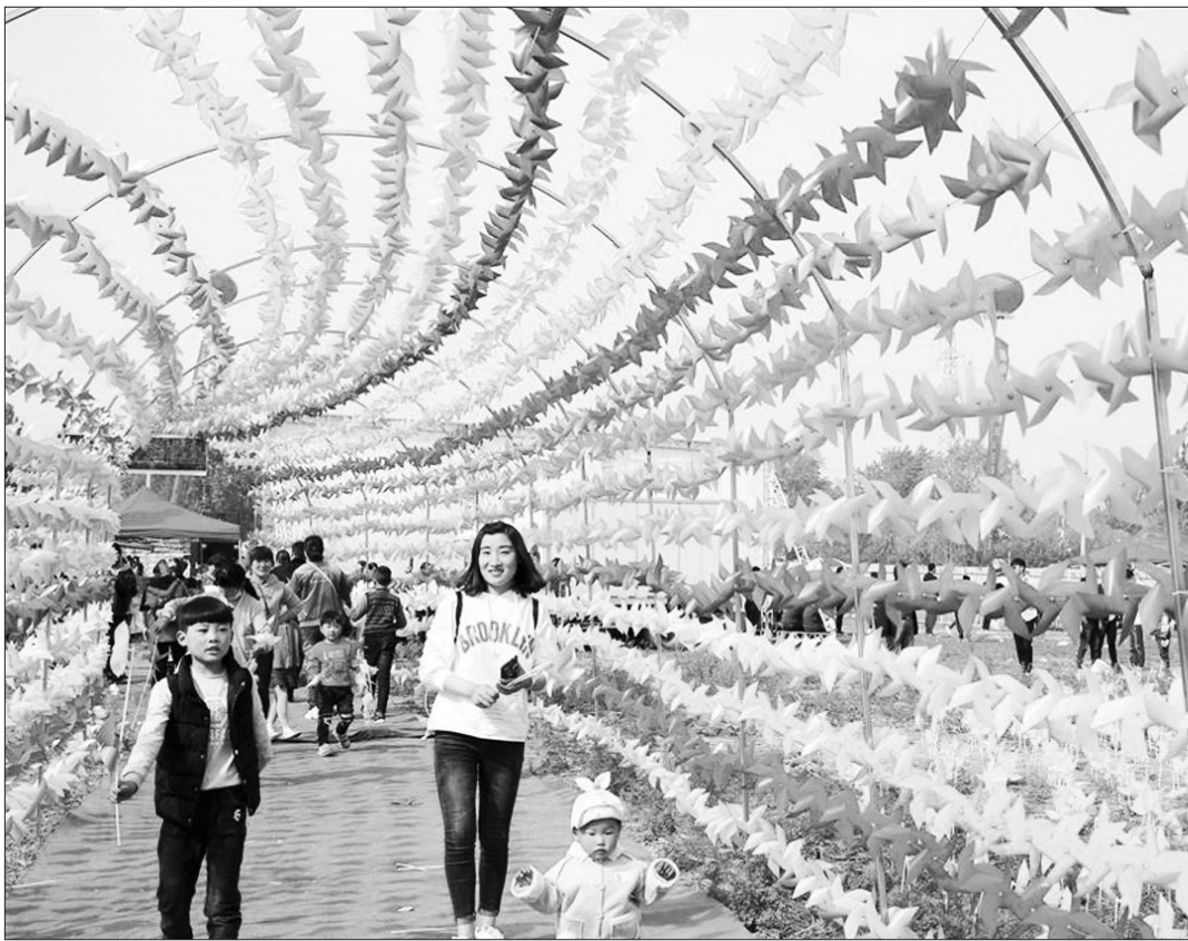
在安徽省淮北市濉溪县蒙村日前举办的首届七彩风车节上,20多万只被设计成各种造型的风车随风旋转,展现出一副精美的田园画卷,让市民徜徉于童话般的风车海洋中,领略浓浓的乡村田园春意。

为确保此次督查成效,达到预期目的,正式开展督查工作前,自治区专门对参与此次督查的人员进行了部署动员和系统培训。要求督查人员找准工作方向,把握督查重点,全面掌握各地生态环境问题整改落实情况,认真查找整改工作责任落实等方面存在的突出问题。