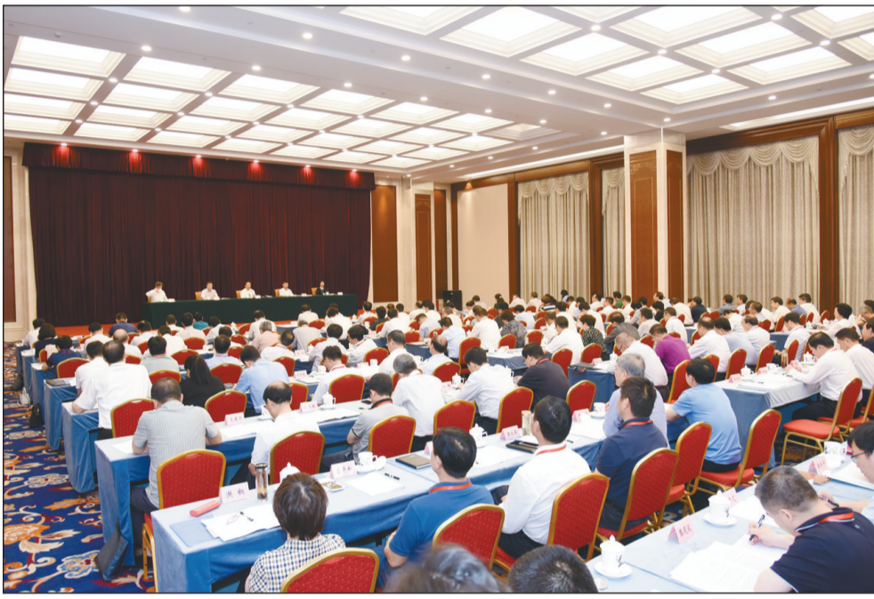
5月29日,2018年全国生态环境宣传工作会议在京开幕。生态环境部部长李干杰出席会议并讲话。

李干杰表示,要以习近平生态文明思想和总书记关于新闻舆论工作新思想新要求为指导,扎实做好生态环境宣传工作。习近平生态文明思想内涵丰富、博大精深,是标志性、创新性、战略性的重大理论成果,是新时代中国特色社会主义思想的重要组成部分,是新时代生态文明建设的根本遵循与最高准则,引领生态环境保护取得历史性成就、发生历史性变革。习近平生态文明思想和总书记关于新闻舆论工作的新思想新要求,为做好生态环境宣传工作提供了方向指引、根本遵循和实践指南。