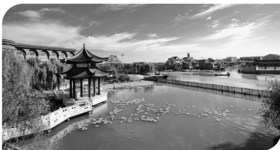
国家级生态镇——溱潼

据不完全统计,目前各村(居)委会通过“两个委员”牵头组织各类环保宣传活动1200余场(次),源头化解各类轻微环保纠