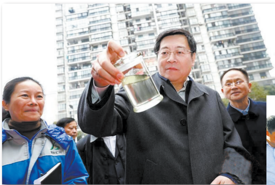
▲湖南省委书记杜家毫专题调研耕地重金属污染修复治理工作,强调要持之以恒做好这项工作,更好地传承和维护湖南“鱼米之乡”的美誉。

在推动区域绿色发展上,党政主要领导必须打头阵做表率。污染防治攻坚战不仅能够推动环境质量持续改善,也能够倒逼产业转型升级、实现绿色发展。为此,要深化绿色发展理念,把推动绿色发展作为对自身政治觉悟、党性修养的现实检验,充分认识绿色发展是必然选择、必由之路,同时带动班子成员和所属干部系统学习领悟,切实把绿色发展理念融入血脉、落在行动。要保持绿色发展定力,既要有刮骨疗伤的勇气,大力淘汰落后产能,深入实施“散乱污”企业整治,割掉产业转型升级的黑尾巴,也要有探索创新的胆量,强化创新驱动,发展绿色产业,推动经济提质增效。要健全绿色发展机制,加快推动生态文明体制改革,逐步健全生态文明建设领域的各类法律法规和政策措施,并落实到产业规划布局、生产过程污染控制、生态修复、自然资源资产审计和责任追究等各环节,保障生态文明建设高效稳步向前。