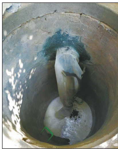
垃圾渗滤液由此汇入市政污水管网。