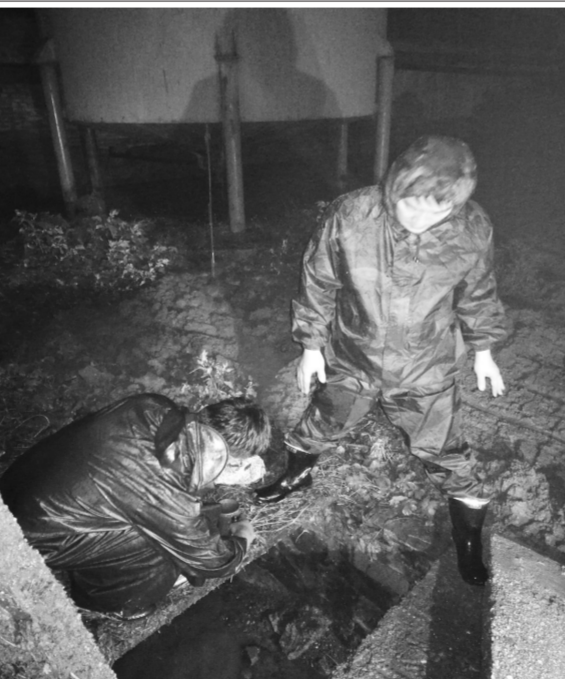
随着雨季的到来,一些企业在雨水的掩护下偷排废水,对水环境造成污染。为防止沿河企业借雨偷排,山东省招远市环境执法人员加大对辖区界河两岸排污口的巡查力度,严厉打击偷排偷放等环境违法行为。