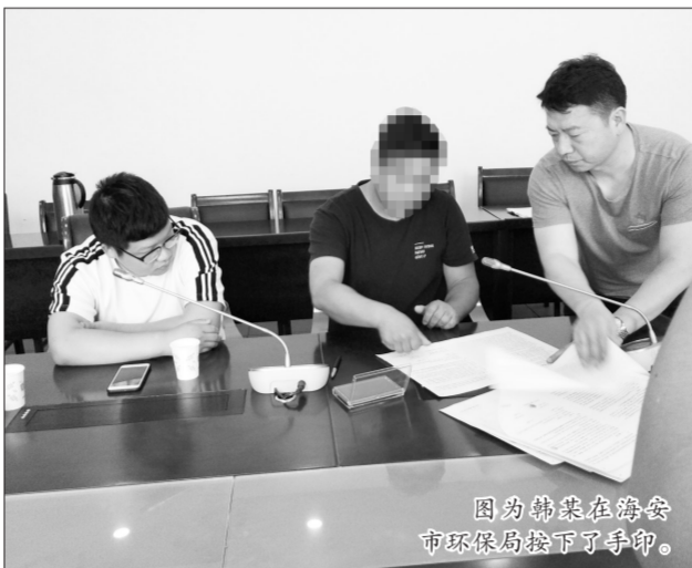
图为韩某在海安市环保局按下了手印。