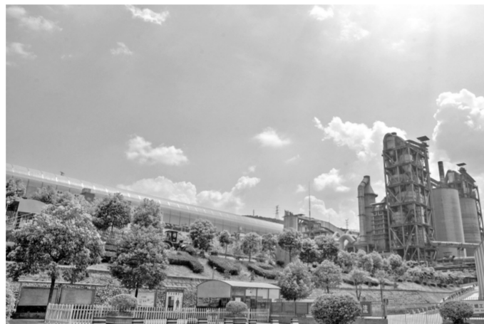
东方希望重庆水泥绿色厂区一角

公司地处三峡库区腹地,拥有长江黄金水道,建设有4个5000吨级供熟料、水泥、原辅料装船的长江专用码头,日装船能力可达6万余吨,销售区域覆盖整个长江流域及其周边区域。由于紧邻港口,煤炭和水泥运输距离短,对周边生态环境影响较小,相比汽车运输,水路运输更能实现经济效益和环保效益的有效统一。