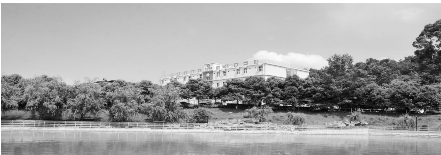
东方希望重庆水泥循环水池

随着国家对生态环境保护的要求日益提高,水泥行业的竞争已经成为生态环保的竞争,绿色水泥工厂不仅符合生态文明建设需要,也是企业自身发展的需要。东方希望重庆水泥将始终贯彻循环经济理念,走绿色可持续发展道路,竭力发挥企业相对优势,精益求精,持续改善,继续以绿色发展助推产业转型升级,不断创造企业环保竞争优势,创建行业环保标杆,实现经济效益、环境效益、社会效益的多赢。 重水 申健康