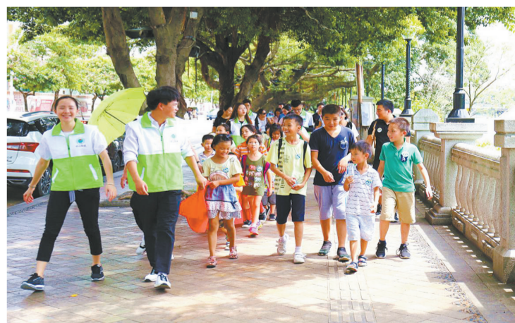
广东省中山市环保局近日举办“绿色中山 全民共建”环保公益系列活动。启动仪式上,30位“环保小卫士”倡议市民共建美丽中山...