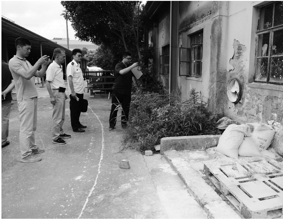
图为督察组正在进行现场核查。

督察组高度重视群众信访举报问题的查处,要求边督边改,即知即改,积极回应社会关切,累计向3区交办有效举报496件,已办结406件。督察期间,3区合计责令整改企业475家,立案处罚340家,共计罚款5146万余元,查封企业4家,约谈83人。