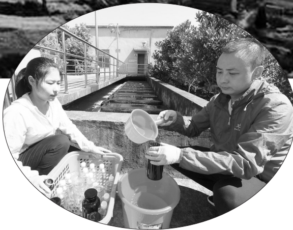
环保人员在高温环境下采水样。