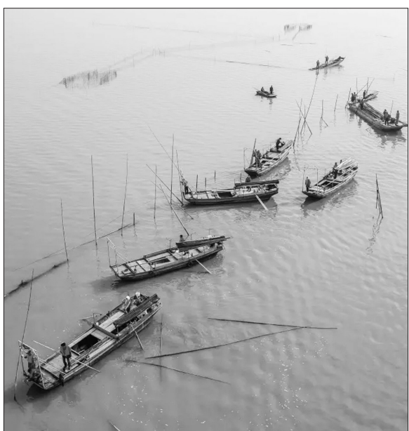
湖北省加大水环境治理,开展湖泊拆违行动。

先编制实施长江经济带生态保护和绿色发展总体规划,配套编制5个专项规划,并出台《关于大力推进长江经济带生态保护和绿色发展的决定》等多部地方性法规,并提出了大力开展长江大保护“九大行动”,积极实施长江大保护十大标志性战役和长江经济带绿色发展“十大战略性举措”,整体推进“四个三重大生态工程”等重大举措。