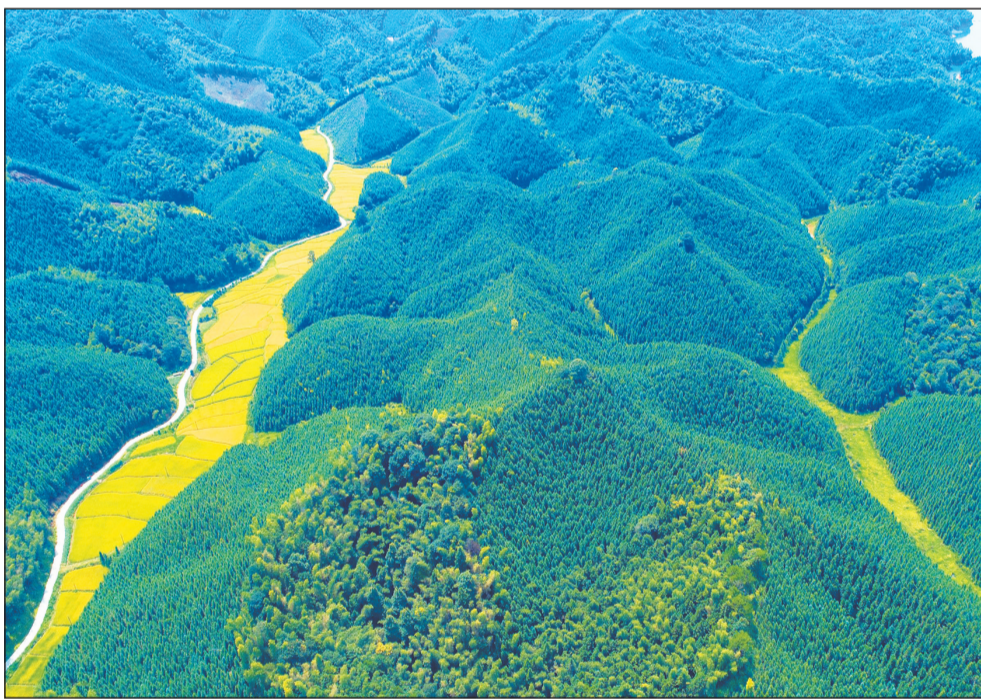
近年来,江西省泰和县大力推进绿化荒山,着力改善县域生态环境。图为桥头镇店前村完成绿化的山峦,一望无际,雄伟壮观。

通过上下联动,省级专项帮扶行动精准,督查有力,徐州市上下思想认识进一步提高,执法能力得到加强提升,企业减污减排自觉性进一步增强,徐州的大气环境质量呈现改善趋势。