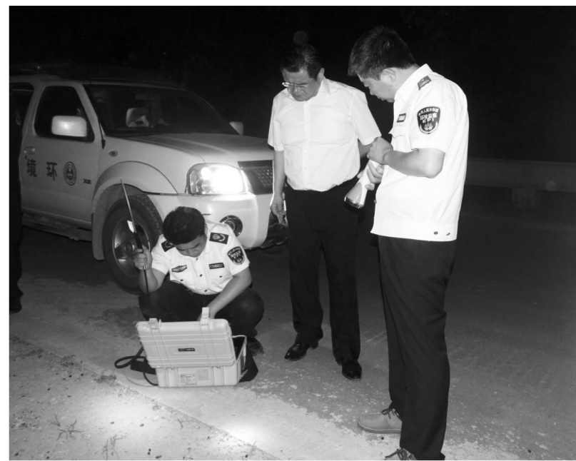
为改善生态环境质量,滨州市不断加大环境执法力度,严打环境违法行为,确保企业达标排放。图为环境执法人员对企业进行夜查。

在环境信息公开方面,滨州市及时将中央环保督察问题整改、饮用水源地整改和大气强化督查等信息,通过报纸、门户网站、微博、微信等渠道发布,既接受公众监督,又保障公众的环境知情权。