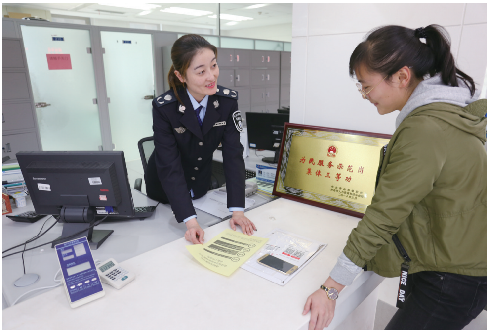
环保审批大厅窗口工作人员对照《办事指南》,耐心向办事企业讲解环评审批流程。

“既要做好环保行政服务保障功能,又要发挥生态环保的倒逼作用,坚守环境质量只能变好、不能变坏的底线,加快解决突出问题,推进高质量发展。”今年7月,青岛市环保局党组书记、局长杨钊贤对深化环保领域“放管服”和“一次办好”改革提出进一步要求。生态环保部门兼有审批权与执法权,承担着为企业营商松绑、为群众办事除障、为环境公平护航的现实使命。如何走好环境监管与公共服务的平衡木,找准打赢污染防治攻坚战与高质量发展协同兼顾的着力点,一直是青岛环保推进“放管服”改革的探索方向。