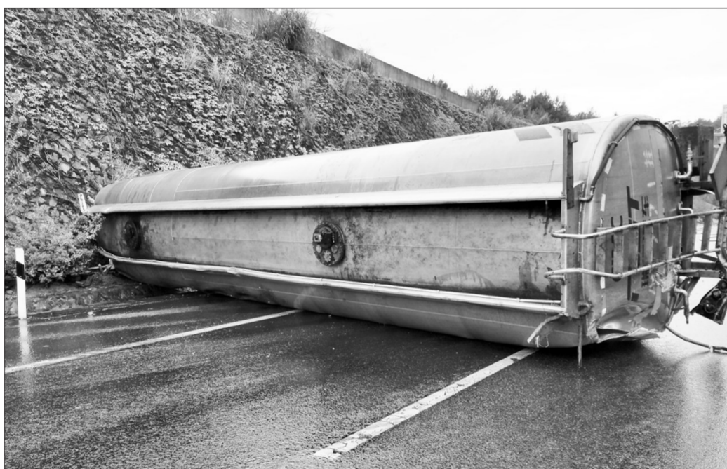
日前,福银高速公路江西往邵武方向B道329k+300米处,一辆运载大豆脂肪酸的槽罐车发生侧翻导致泄漏。车辆运载的33吨大豆油全部泄漏至高速公路雨水沟渠。接到报警后,福建省邵武市环保局组织应急、监测等处置人员,第一时间赶赴现场,立即进行取样监测,并对泄漏液体进行分级截污分流,使用油毡布对油污进行吸附收集处置,成功阻止泄漏油污排入外环境。

同时,寿光市广泛宣传动员,号召全民共享共治。通过实施“一百加一万”环保工程,形成“一带百万”的社会效应,对环境违法行为保持“露头就打、人人喊打”的高压监管态势。