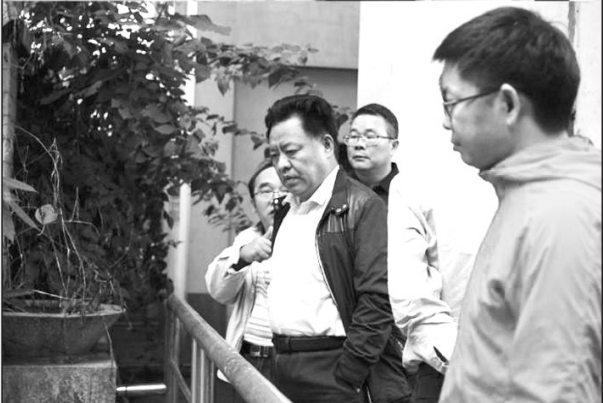
时间:二〇一八年十月二十四日 地点:(上图)南宁市医院,做头部CT;查看颅内出血点和水肿情况(下图)广西南宁市朝阳溪,带领巡查组查看黑臭水体整治情况