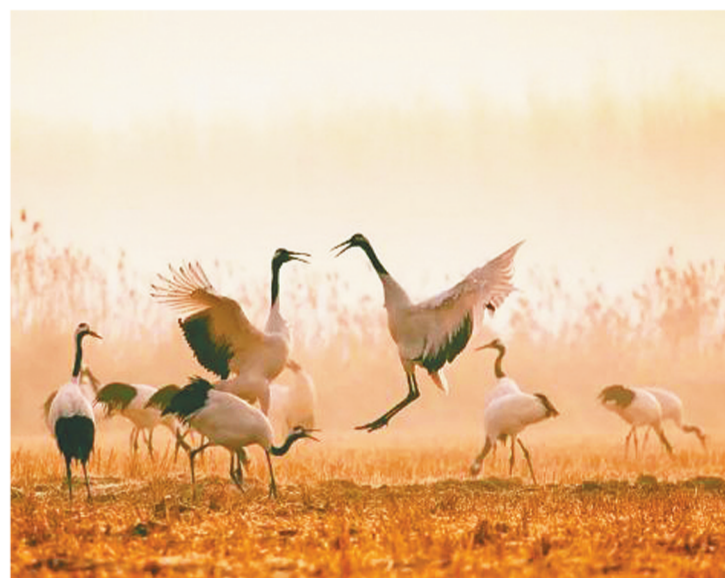
近年来,江苏省射阳县加大对沿海重要湿地、丹顶鹤自然保护区核心区和缓冲区、清水廊道维护区、饮用水水源保护区、重要生态水域等生态红线保护区域的保护力度,加快推进区域湿地生态保护和生态修复,不断纯洁生态湿地发展底色。图为射阳湿地生态美景。