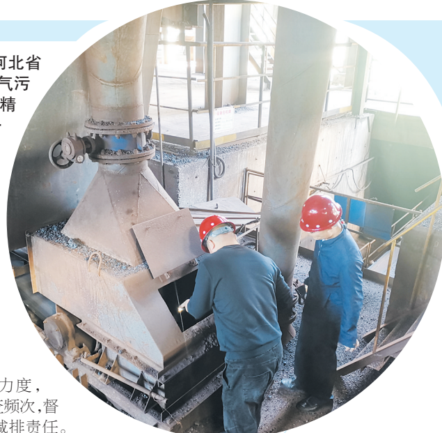
唐山市生态环境局组织开展秋冬季执法检查,图为执法人员现场检查企业治污设施运行情况。

10月26日,距离2020年年终还有66天。这一天,河北省石家庄市委副书记、市长邓沛然主持召开全市秋冬季大气污染防治攻坚战推进会要求,“各级部门要以只争朝夕的精神,最严最高的标准、有力有效的措施,一天一天努力,一微克一微克地抓,全力以赴推进大气环境质量持续改善、根本好转。” 进入秋冬季以来,这样的“一把手”调度会,在河北省已是常态。持续开展秋冬季治气攻坚行动,河北省要求各地,强化精准管控,突出治本攻坚,有力有序有效推进大气污染综合治理,确保完成全年目标任务。