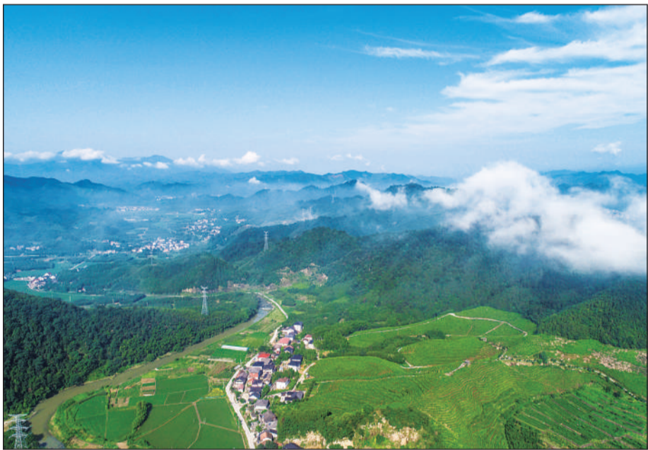
近年来,浙江省杭州市临安区天目山镇结合全域整治、美丽城镇建设等,利用生态优势发展乡村旅游产业,农村人居环境焕然一新。图为在天目山镇,绿水青山和村庄相映成景。